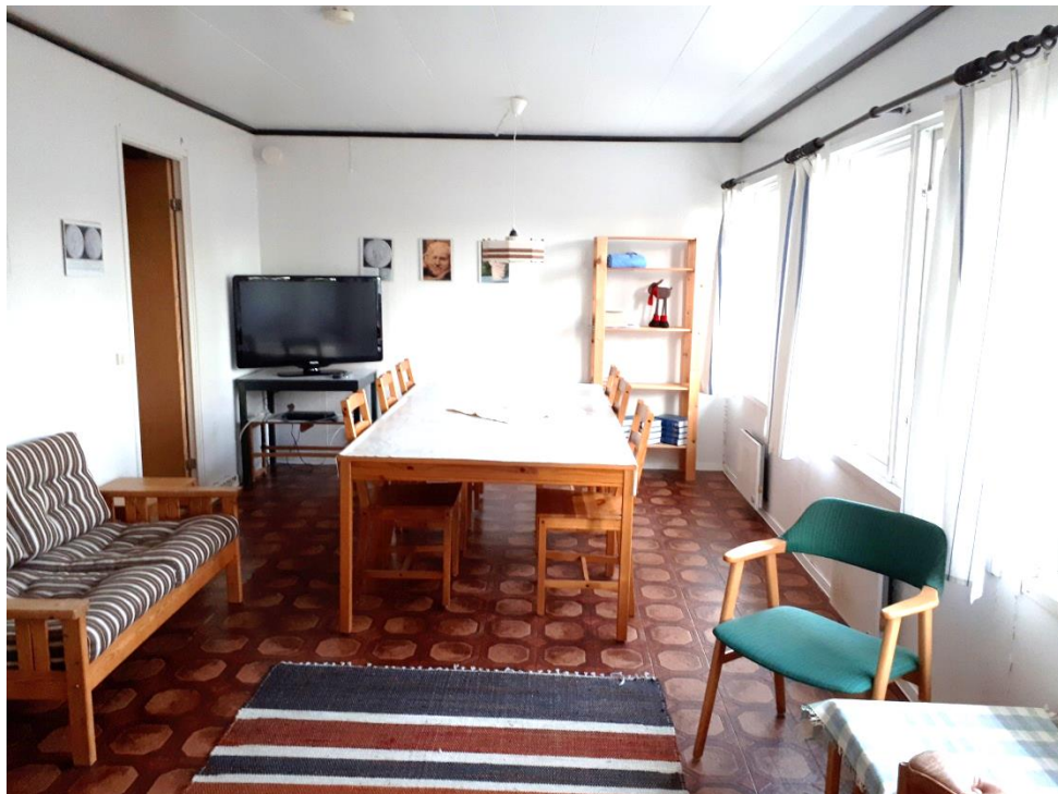
STUGA FÖR SJÄLVHUSHÅLL – TVÅ FYRABÄDDARS RUM OCH MATPLATS I ALLRUMMET

”Pippistugan” har ett allrum som är ljust och öppet med ett stort matbord och en sittgrupp. Här får även husdjur följa med. Stugan passar bra för den som vill uppleva fjällen i grupp.