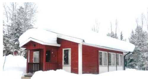
Stuga 3 i vinterskrud