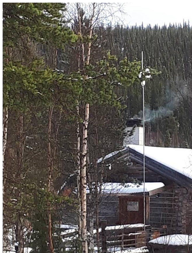
Skorstenen på Kafé Vindelälvan berättar att fiket är öppet.

Kafé Vindelälvan är öppet varje helg och du kan även boka en ryggsäck med termos och utflyktsfika att hämta här.