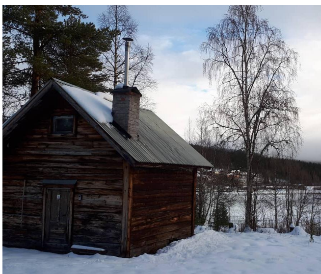
Timmerkojan ”Smesspojken” på stranden av Vindelälven.

Vi har alltid två lägenheter varma, även nu på vintern, så du kan komma till oss på kort varsel. Det finns också en enkel timmerkoja inom ett stenkast från receptionen för dig som vill öva dig i vildmarkslivet.